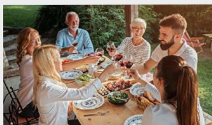
Pensioen in het buitenland Waar u op moet letten